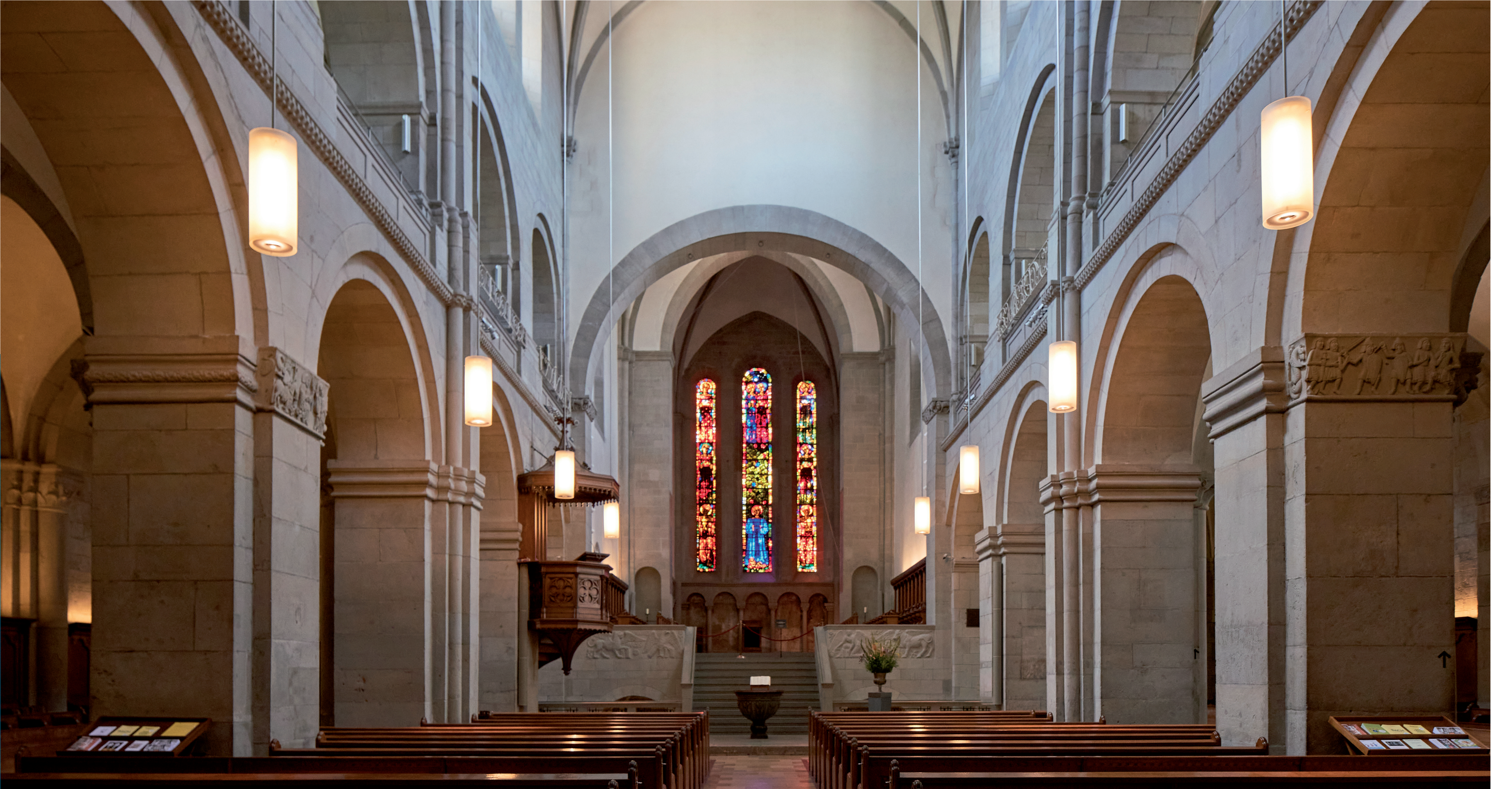
Hauptschiff mit Blick zum Chorraum mit Giacometti-Fenstern

Am Grossmünster stehen in den nächsten Jahren zahlreiche Instandsetzungs- und Anpassungsarbeiten an. In einem ersten Schritt werden im Innenraum konservatorische Arbeiten ausgeführt. Diese umfassen unter anderem die von Augusto Giacometti erschaffenen Chorfenster oder die Achat- und Glaskunstfenster von Sigmar Polke, wie auch die Glasmalereien von Jakob Röttinger aus dem 19. Jahrhundert, welche einer Spezialreinigung und punktuellen Reparaturen unterzogen werden. Die Wandmalereien, insbesondere in der Krypta, werden konservatorisch gesichert. Die Sandsteinstufen im Turmaufgang werden ausgebessert, um die Stolpergefahr zu reduzieren. Auch die Holztreppen in den Türmen werden wo nötig instandgesetzt. Weiter gibt es am Hauptdach sowie dem Dachreiter einzelne statische Mängel, die von innen behoben werden können.